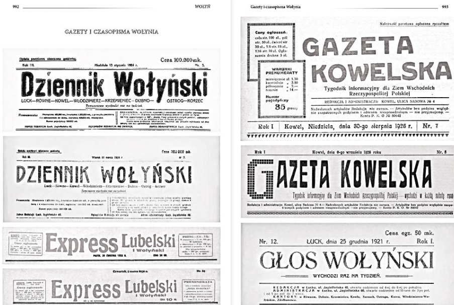
Ilustracja 5. Nagłówki prasy wołyńskiej