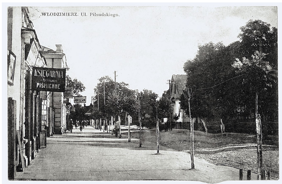
Ilustracja 2. Pocztaówka pokazująca lokalizację księgarni we Włodzimierzu Wołyńskim