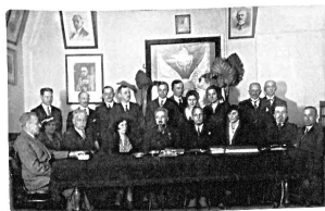
270. Grono nauczycielskie Szkoły Handlowej PMS w Równem

w 1938 roku powstały na Wołyniu trzy: w Łucku, Olyce i Sarnach – a także przedszkola, koła opiekuńcze, domy oświatowe i biblioteki. W 1938 roku działa 97 bibliotek stałych i 403 wędrownie, największa powstała się w Równem (im. J. Jarzembskiego, 16 688 woluminów), z innych, większych, należy wymienić w Dubnie (4300 woluminów) czy Krzemieńcu (4000 woluminów). Polska Macierz Szkolna wspomaga wszystkie dzieci bez względu na narodowość.