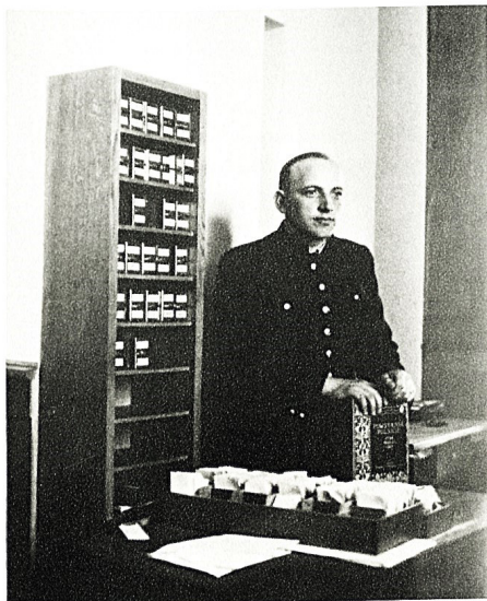
264. Bibliotekarz Liceum Krzemienieckiego