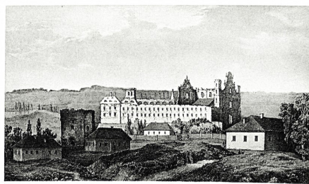
Fig. 117. Ruiny katedry i klasztoru zbudowane przez księcia Michała Ostroskiego, zbudował go św. Ostroski. To spieszny rysunek artysty Józefa Czajkiewicza, opracowany z pod Okrutną 5, 1924.