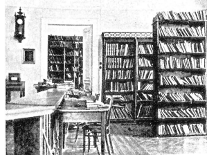
272. Biblioteka PMS im. Jerzego Jarzembskiego w Równem