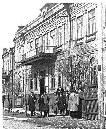
271. Budynek przy ul. Piłsudskiego 13 w Równem, w którym mieści się Szkoła Handlowa i biblioteka PMS