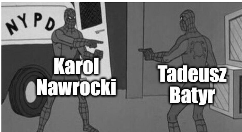
Ilustracja 1. Przykład memu szablonowego