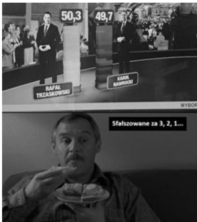
Ilustracja 2. Przykład memu komentującego